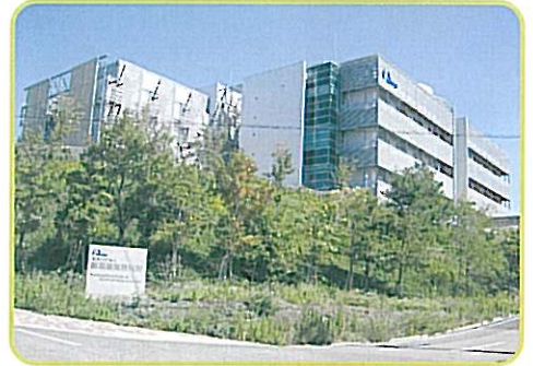
国立研究開発法人 医薬基盤・健康・栄養研究所